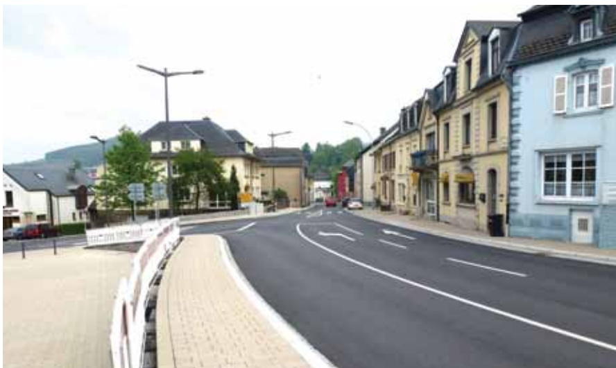
► Die Arbeiten bei der Dekanatskirche gehen dem Ende entgegen

Zwei „klassische“ Grundschulen (Lage: „Avenue Nicolas Kreins“, „Neit Gebai“ und „Aalt Gebai“), die jeweils eine Grundschule