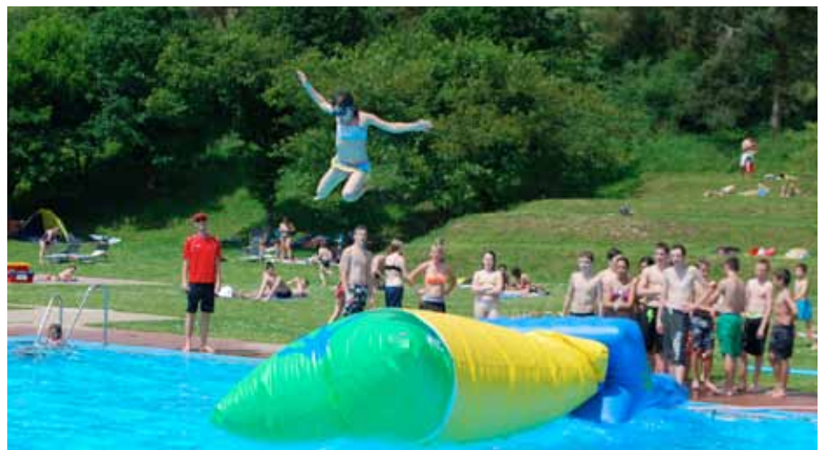
► Viel Betrieb im Schwimmbad „Kaul“

Ein leichter Rückgang war auch bei der Gesamtbesucherzahl im SI-Empfangsbüro zu verzeichnen. 14 638 Besucher wurden hier gezählt, 2012 waren es deren noch 15 191.