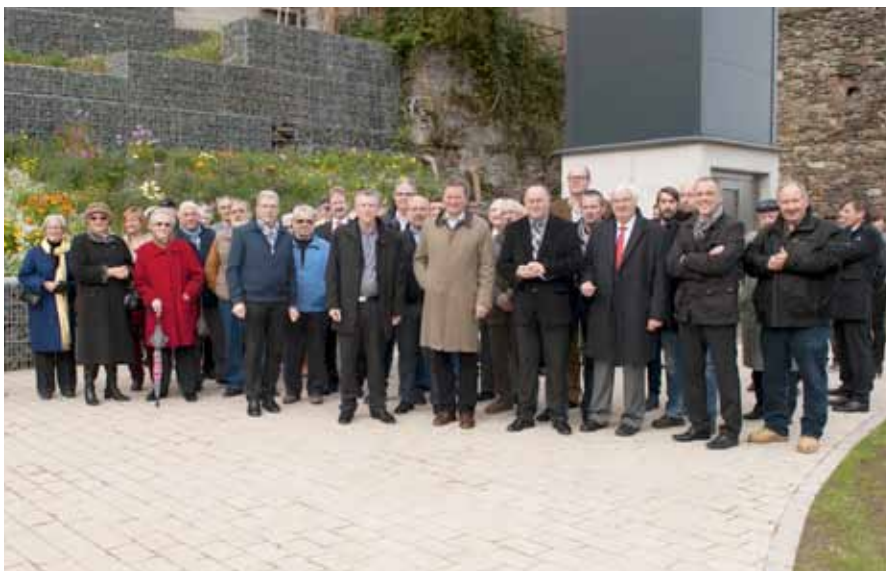
► Die „Passage Weierwee“ wird eröffnet

Die Instandsetzung des Museums hatte als Ziel, mit einer neuen Einteilung der Räumlichkeiten und mit moderneren Mitteln – Dioramen und Abspielen von Videofilmen –, die Ereignisse der schweren Kriegsjahre lebendiger und anschaulicher darzustellen. Dass dies gelungen ist, davon konnte man sich bei der offiziellen Eröffnung am 29. November 2014 überzeugen. (dazu später mehr)