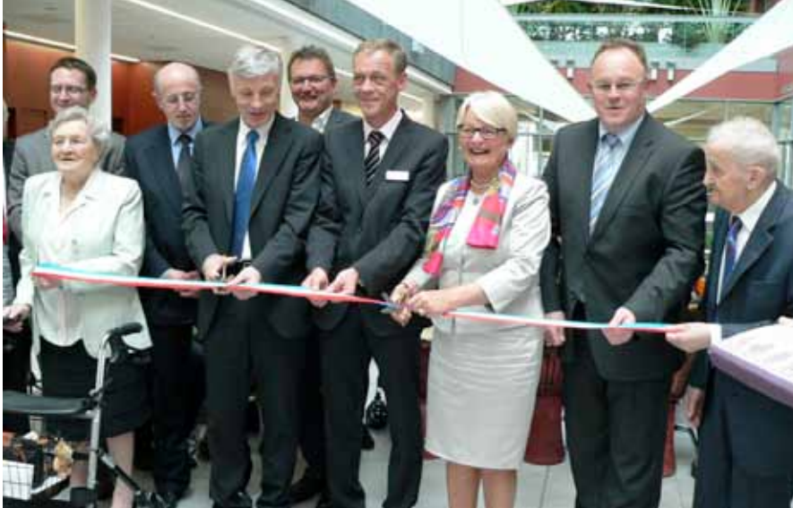
► Drei Minister wohnen der Eröffnungsfeier bei

Heim mit viel Komfort, das den sowohl rüstigen, autonomen Senioren wie auch pflegeberechtigten Personen gerecht wird. Für 120 Senioren konzipiert und in Nähe des Wiltzer Stadtzentrums gelegen, bietet das neue Cipa dank eines 121-köpfigen Betreuerteams wohl alles, was das Herz des dritten Alters begehrt. Um das zentrale Atrium mit Grün- und Wasseranlage herum sind vom Restaurant samt Terrasse über den Einkaufsladen und den Friseursalon bis hin zum Mehrzwecksaal und zur Cafeteria alle wichtigen Dienstleistungsangebote vorhanden.