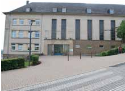
► „Grondschoul Reenert“

Drei Vorzüge der Umgestaltung werden aufgezählt: 1. der Ausbau des Angebots an Betreuung außerhalb der Schulstunden;