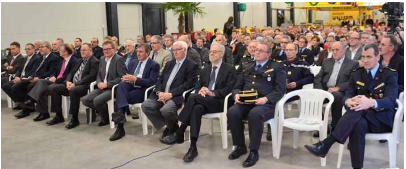
► Bei der Einweihungsfeier des regionalen Einsatzzentrums

An den Fundamenten des Sanatoriums vorbei, gelangt der Wanderer zur Gedenkstätte „Fatima“, von wo aus er eine herrliche Aussicht auf die verschiedenen Viertel der Stadt Wiltz genießt. Am 23. April luden die Stadtverwaltung Wiltz, „natur & ëmwelt - Fondation Hëllef fir d'Natur“, die „Oeuvres Paroissiales Niederwiltz“ sowie das „Syndicat d'Initiative“ Wiltz zur Einweihung der Panoramatafel „Wiltz - Capitale de l'Ardenne Luxembourgeoise“, nahe des Fatima-Denkmal „op Baessent“, ein. An Hand dieser Tafel kann der Besucher sehr gut die historische und industrielle Entwicklung der Stadt Wiltz sowie das Zusammenwachsen der einzelnen Stadtteile nachvollziehen. Außerdem gibt die Tafel Auskunft über die geologischen Formationen des Tals der „Wiltz“.