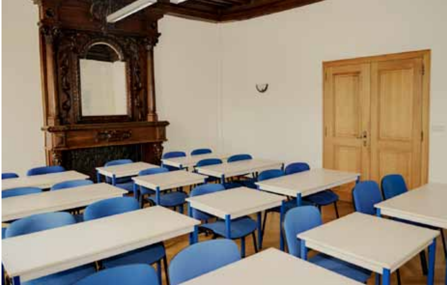
► Ein Schulsaal des BBI