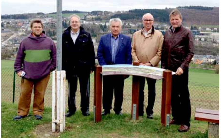
► Einweihung der Panoramatafel „op Baessent“

„Passage Weierwee“: Am 15. Oktober wurde der wichtige Verbindungsweg zwischen dem Seniorenheim „Geenzebléi“ und der „Groussaass“ eingeweiht. Die „Passage Weierwee“ wurde geschaffen, um den CIPA-Pensionären und den Parkplatzbenutzern den Zugang zur höher liegenden „Grand-rue“ zu erleichtern. Sie besteht aus fünf Elementen: einer Passage durch das Haus Nr. 49 in der „Grand-rue“, einer zehn Meter langen „Passerelle“, einem 15 Meter hohen Aufzug, einem neu angelegten Spazierweg zwischen Aufzug