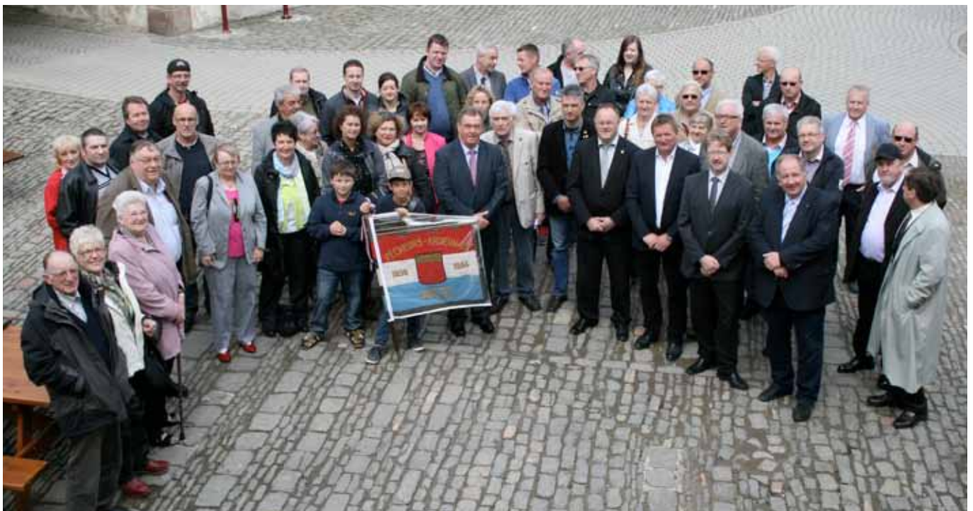
► 75 Jahre „Pêcheurs Ardennais Wiltz“