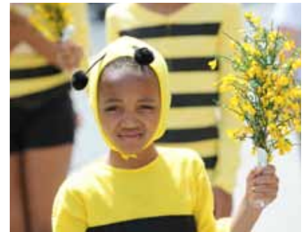
► 66. Ginsterumzug