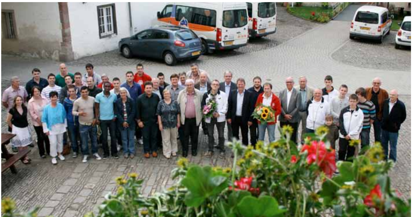
► DT Espoir und FC Wiltz 71 werden geehrt