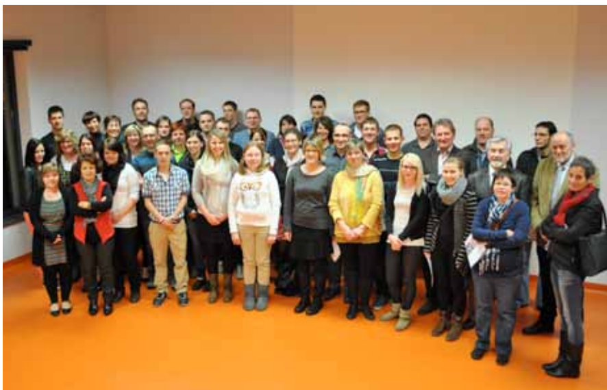
► 43 neue Sekuristen

L wie „Lampions“ , M wie „Martyrs“ , N wie „Nuit“ : „Die 8. Ausgabe der „Nuit des Lampions“ , am 20. September, musste aus Sicherheitsgründen kurz nach 23 Uhr infolge heftiger Regengüsse früher als geplant beendet werden. Zuvor hatte es nicht an Menschenmengen auf der „Place des Martyrs“ und im „Jardin de Wiltz“ gemangelt. Mitunter kam man nur mit Trippelschritten voran. Höhepunkt des Abends war der Auftritt der Kompanie „L'Homme debout“ aus Poitiers (F) mit ihrer Inszenierung „Venus“, in deren Zentrum eine fast acht Meter hohe Weidenrutenmarionette stand, anhand