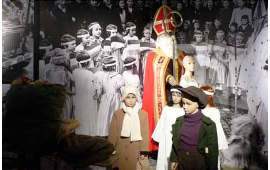
► Diorama im neugestalteten Kriegsmuseum

Herzstück der neuen Ausstellung bilden zweifelsohne die beeindruckenden historischen Szenendarstellungen (Dioramen), bei deren Erarbeitung man dankenswerter-