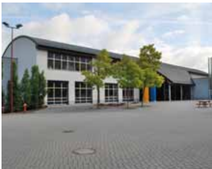
► „Villa Millermoaler“