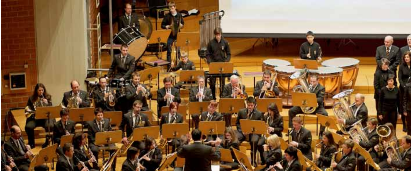
► Die Wiltzer Harmonie beim 150. UGDA-Kongress

und CSV) sowie zwei Enthaltungen (DP) die wie folgt aussehende Haushaltsvorlage 2014: