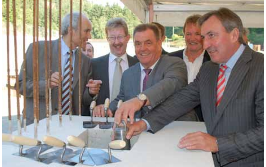
► Grundsteinlegung der neuen Kläranlage

Am 7. Oktober stattete Gesundheitsminister Mars Di Bartolomeo dem „ Centre Hospitalier du Nord “ Wiltz einen Besuch