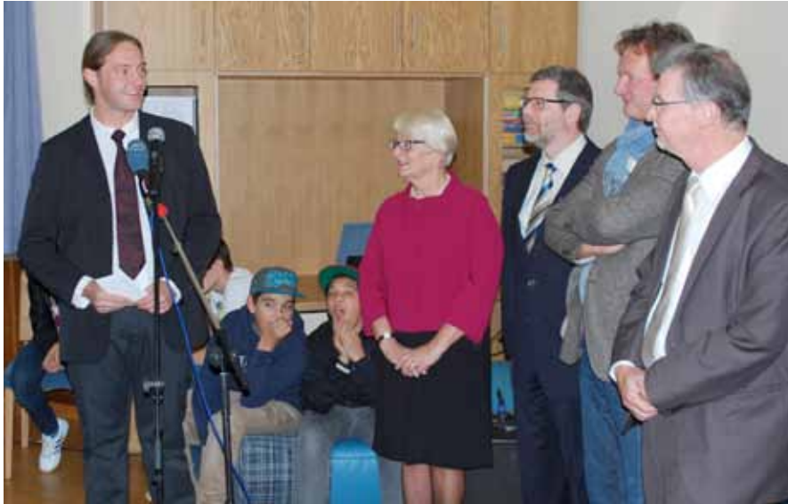
► Eröffnung des „Internat du Nord“