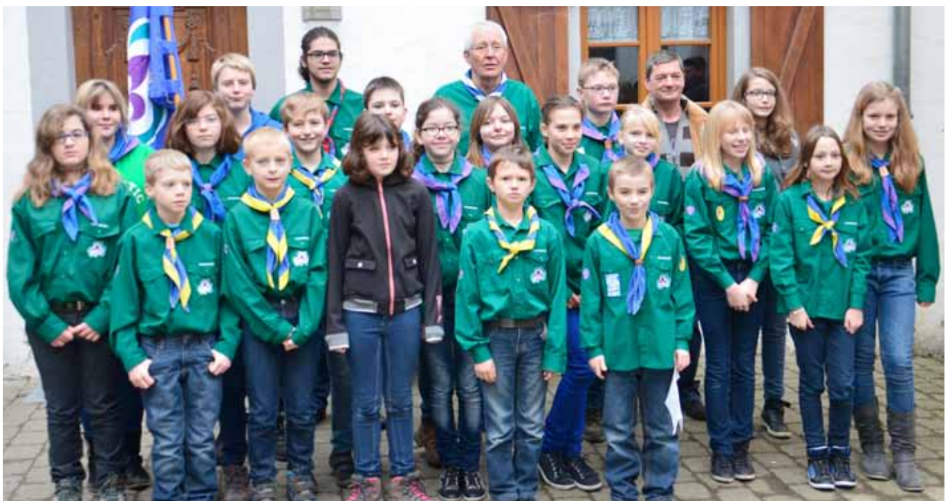
► Sie legten ihr Pfadfinderversprechen ab