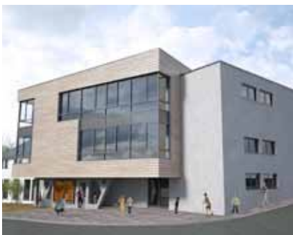
► „Villa Mirabella“

2. die abwechslungsreichere Gestaltung des Angebots, indem eine Struktur geschaffen wird, welche die Schulen und „Maisons Relais“ innovativer und besser auf die Bedürfnisse der Kinder abstimmen kann; 3. das Entstehen von drei überschaubaren Strukturen, was die Betreuung der Schüler