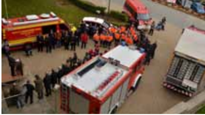
► Fünf neue Rettungsfahrzeuge für Wiltz

Am Samstag, dem 12. Mai, nahm Wiltz zum ersten Mal an der „Nuit des Sports“ teil.