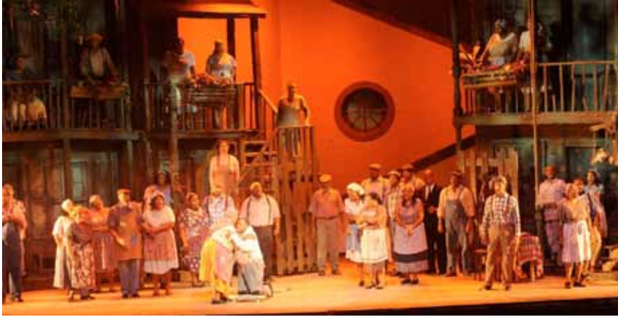
► Porgy and Bess

verzeichneten. Demgegenüber würden beträchtliche Investitionen stehen, etwa für die neue Beleuchtung und den „Walkway“, der es den Künstlern erlaubt, bei schlechtem Wetter trocken auf die Bühne zu gelangen. (...)