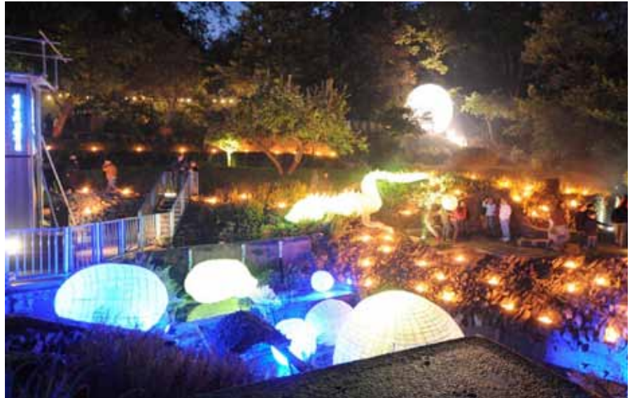
► Nuit des Lampions 2012

Vom 31. August bis zum 2. September konnte die vom „Weeltzer-Timberveräin“ und der „Amicale des Anciens de Tambow“ im Kultursaal des Wiltzer Schlosses besichtigt werden. Zu sehen waren Briefe, Fotos, Bilder und Zeitungsabschnitte über den Streik, die Zwangsrekrutierung und das Lager Tambow. In diesem rund 420 km südöstlich von Moskau gelegenen Lager wurden rund 1000 zwangsrekrutierte Luxemburger von den Russen gefangen gehalten. 167 von ihnen starben dort an Kälte, Hunger und Krankheit.