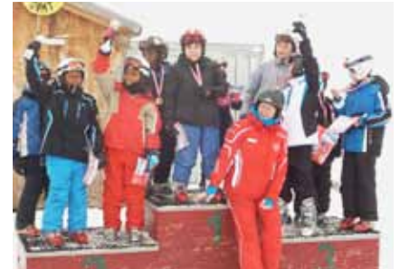
► Viele Pokale und Medaillen für die Schulkinder

Die Schneeklasse begrenzte sich jedoch nicht nur aufs Schifahren. An jedem Tag standen Besuche verschiedener Betriebe, spannende Aktivitäten oder lehrreiche Vorführungen auf dem Programm.