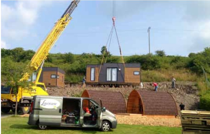
► Die „Mobilhomes“ und „Pod“-Holzhütten werden installiert

Er sprach sich für das ehrgeizige Projekt aus, in der „Kaul“ ein regionales Freizeitzentrum unter freiem Himmel entstehen zu lassen, mit u.a. einem Bike Park, zwei neuen „Mobilehomes“ und zwei Holzhütten des Typs „Pod“. Das Schwimmbad sei ab Sommer 2013 geheizt.