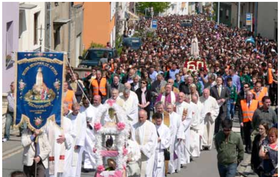
► Tausende pilgern zum Fatima-Heiligtum

Arndt stellte in Aussicht, dass nach dem „Brussels Business Institute“ mit großer Wahrscheinlichkeit noch weitere Hochschulen in das Schloss einziehen würden. Die Gemeinde sei gewillt, mit diesen Schulen Hand in Hand zu arbeiten, damit nicht nur ein neues, sondern auch längerfristiges Leben auf Schloss Wiltz einkehren könnte.