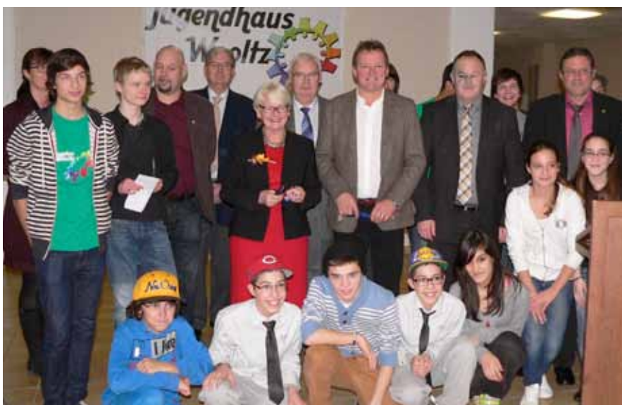
► Eröffnung der neuen Räumlichkeiten des Jugendhauses

Er befürwortete einstimmig den Mietvertrag mit „CFL Immo S.A.“ betreffend das Anmieten des Wiltzer Bahnhofs durch die Gemeinde für die Dauer von 40 Jahren zum jährlichen symbolischen Euro.