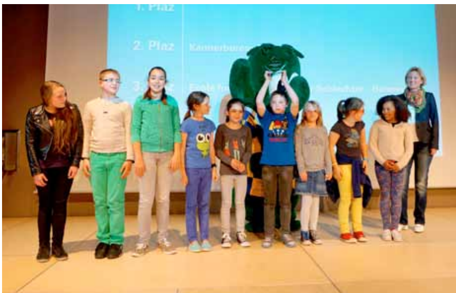
► Zweiter Platz für das „Kannerbureau Wooltz“