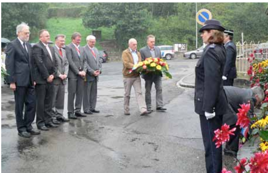
► Blumenniederlegung vor der ehemaligen „Ideal“, am Ausgangspunkt des Generalstreiks vor 70 Jahren

Wöchentlich wurden 143 Unterrichtsstunden abgehalten, wie der Direktionsbeauftragte Marcel Hinger hervorhob.