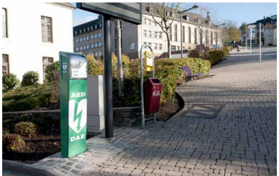
► Der Defibrillator im „Schulberg“