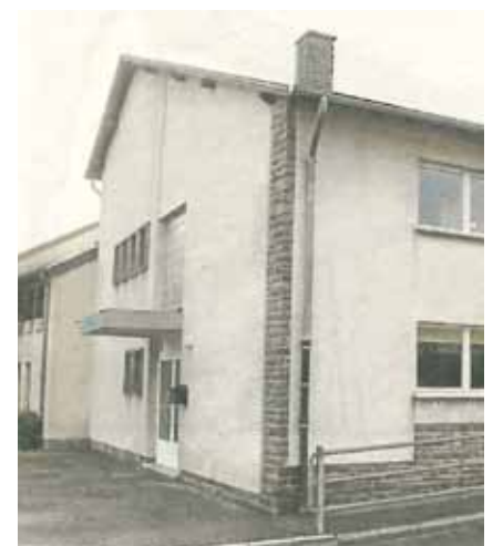
► „Nidderweeltzer Spillschoul“

Die Gesamtzahl der Kinder in den drei Wiltzer Grundschulen beläuft sich damit auf 612.