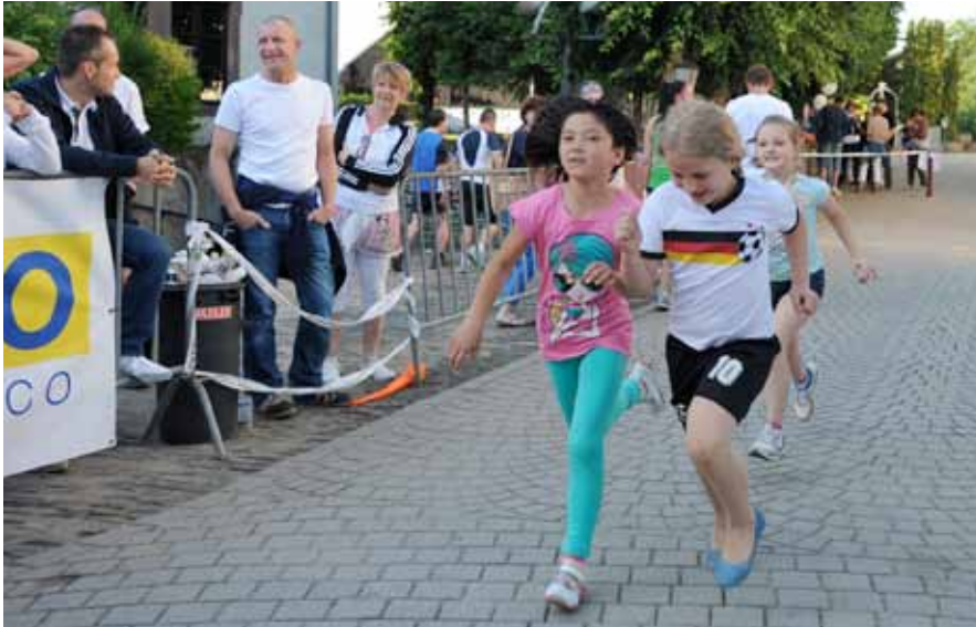
► 24 Hours Run

Strecke der „24H Run“ und ein „Spinning Marathon“ auf dem Festivalplatz statt. Auf einer großen Leinwand konnte man natürlich auch die Spiele der Fußball-WM verfolgen.