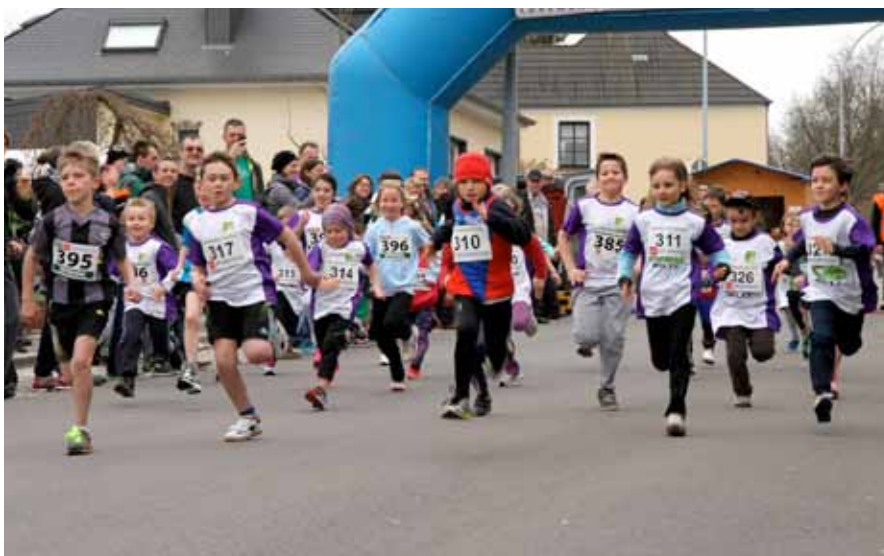
► Der Semi-Marathon de la Paix fand zum letzten Mal statt

In der Mai-Ausgabe der „Zeitung fir Wooltz an d'Regioun“ wird das UBI wie folgt vorgestellt: L'UBI est une université privée délivrant des formations postsecondaires des types „Bachelor“ et „Master“ avec à la clé un diplôme de „Master of Business Administration“. Ces diplômes correspondent au programme anglo-américain des études économiques et sont validés par l'Université du Pays de Galles au Royaume-Uni. L'UBI, qui dispense