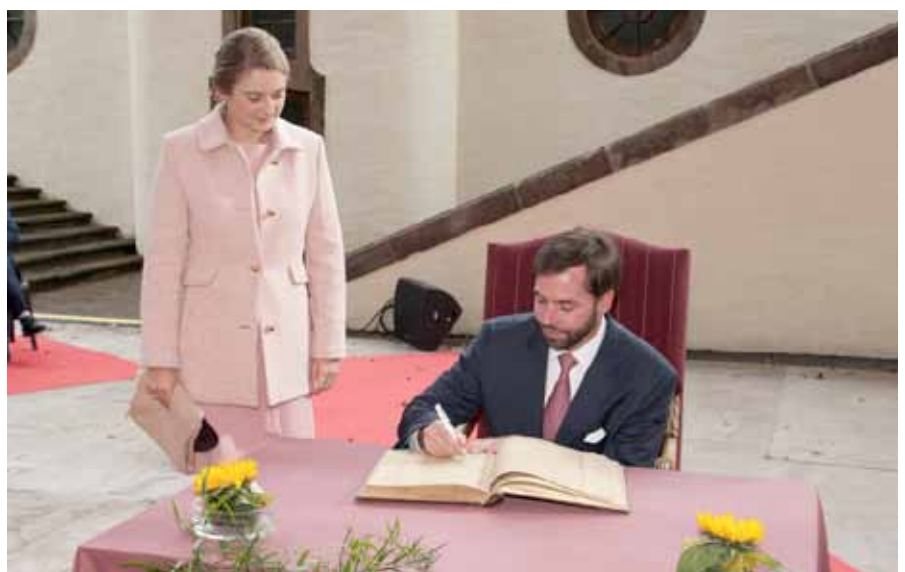
► Erbgroßherzoglicher Besuch