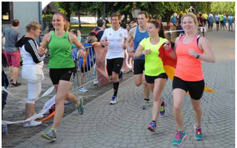
► 24 Hours Run

„Coopérations asbl“ war für die Organisation verschiedener Konzerte zuständig, die im Rahmen der „Fête de la Musique“ für gute Stimmung auf dem Rundkurs sorgten, während 16 Wiltzer Vereine sich um das leibliche Wohl der Teilnehmer und der Zuschauer kümmerten. Am Sonntag fanden ein Kinderlauf auf der