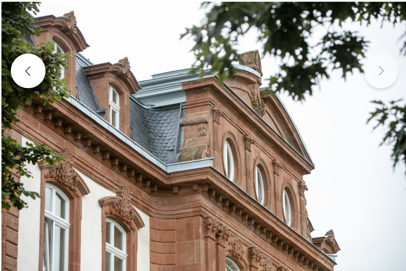
Le toit mansardé est typique de l'époque.

Lors des travaux lancés en 2016, de l'amiante avait été découvert, obligeant toute l'administration à déménager. De plus, des vers à bois avaient endommagé des poutres, compromettant la stabilité de la villa. La toiture était également bancal et a dû être démontée et remontée.