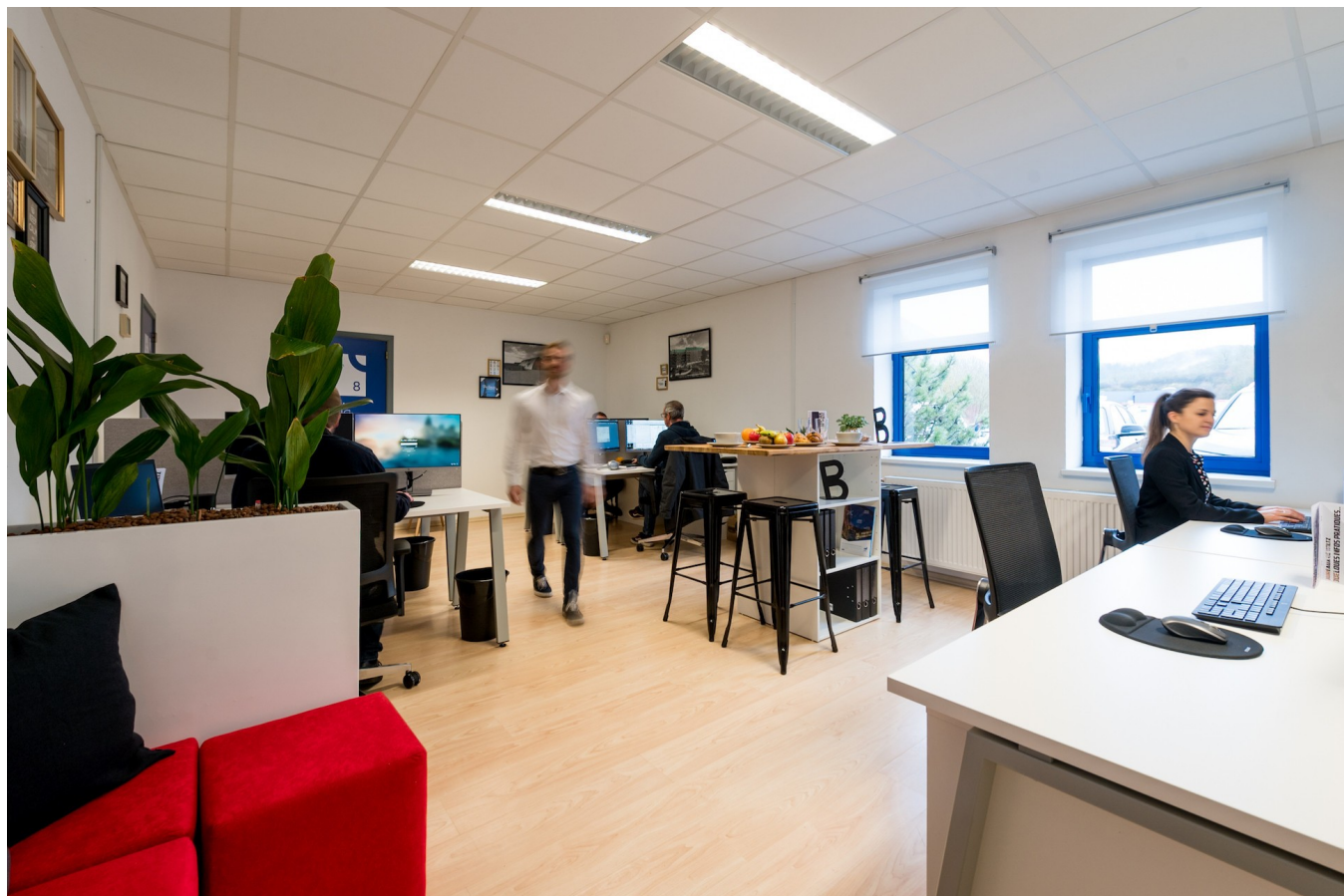
Vue des nouveaux bureaux Betic à Wiltz.