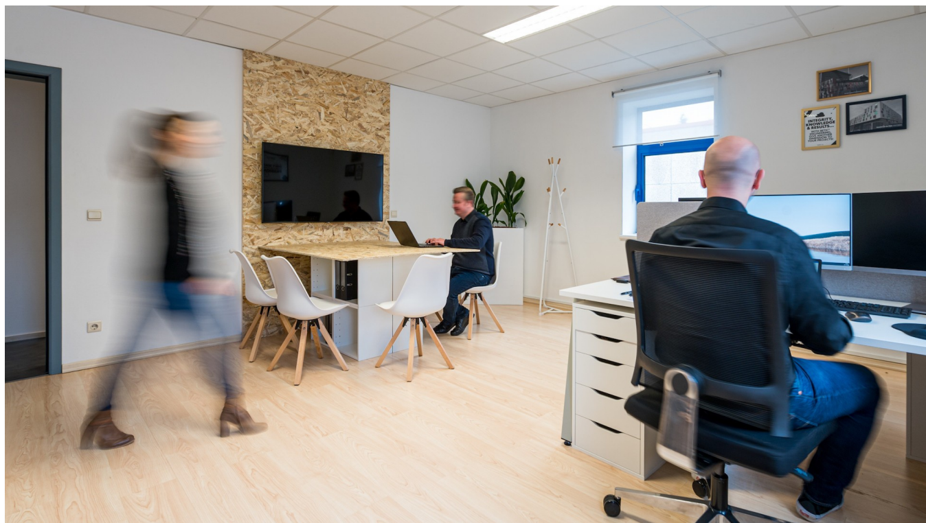
Vue des nouveaux bureaux Betic à Wiltz.