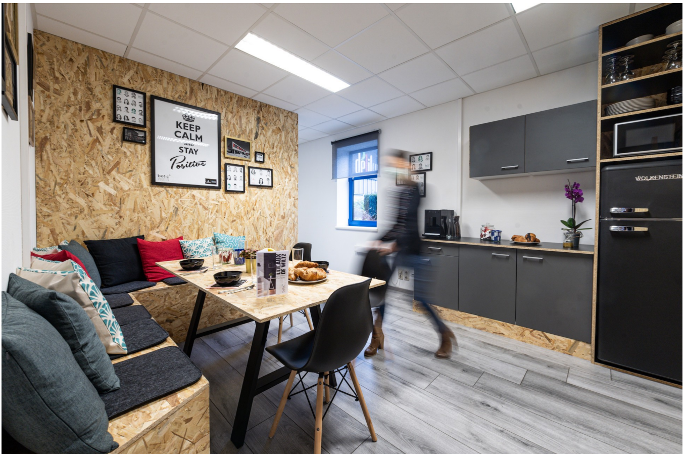
Vue des nouveaux bureaux Betic à Wiltz.