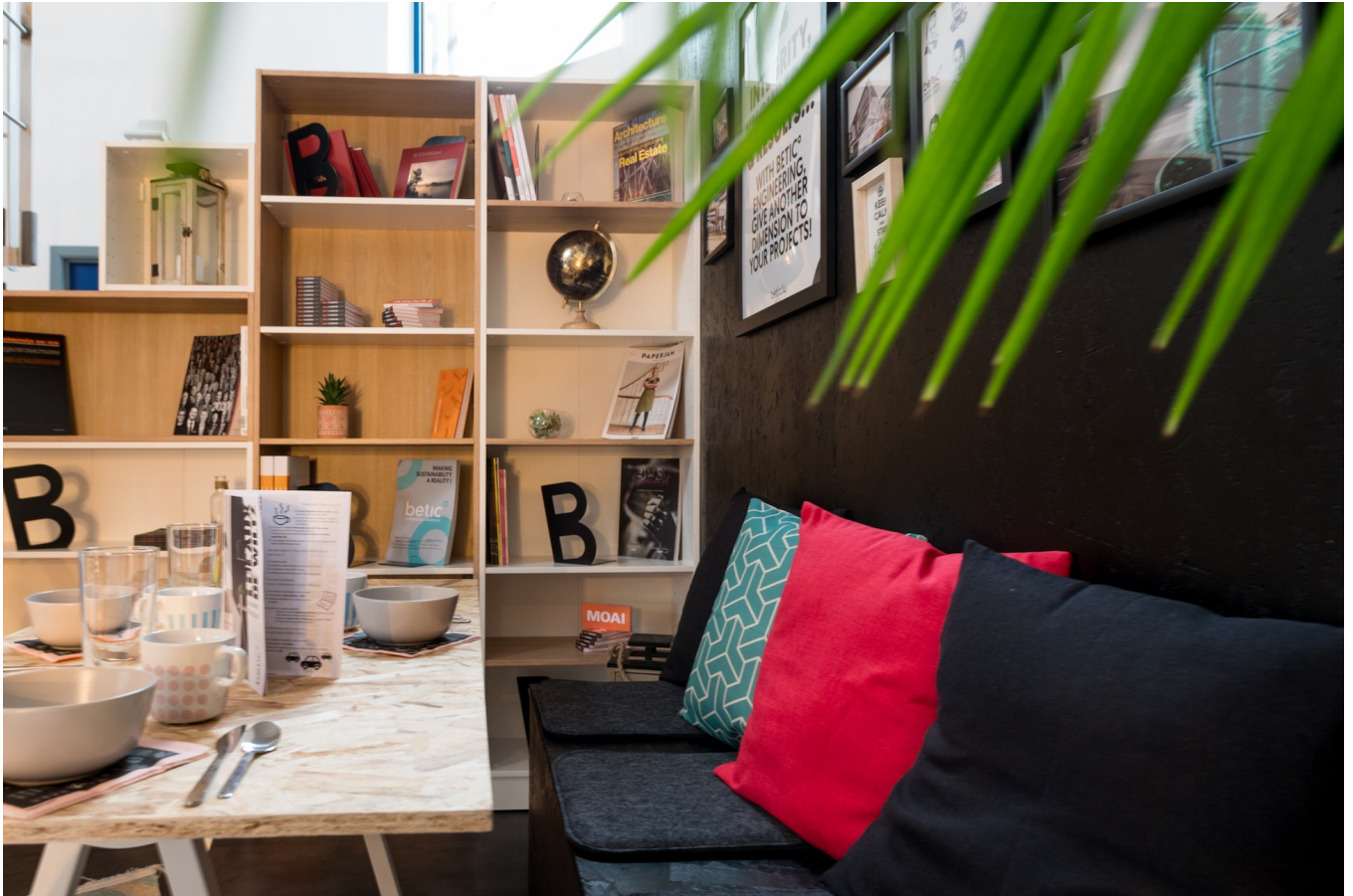
Vue des nouveaux bureaux Betic à Wiltz.