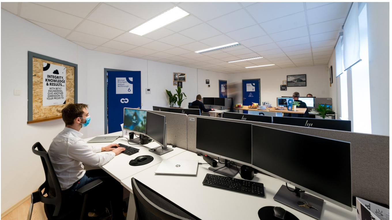
Vue des nouveaux bureaux Betic à Wiltz.