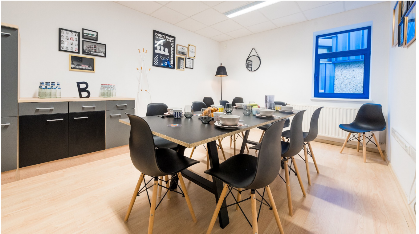
Vue des nouveaux bureaux Betic à Wiltz.