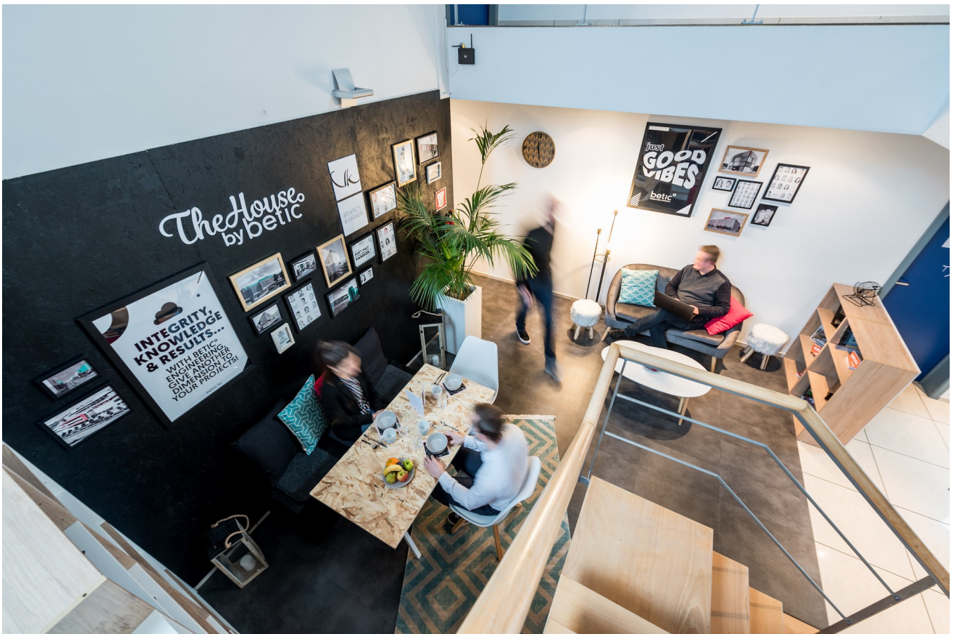
Vue des nouveaux bureaux Betic à Wiltz.